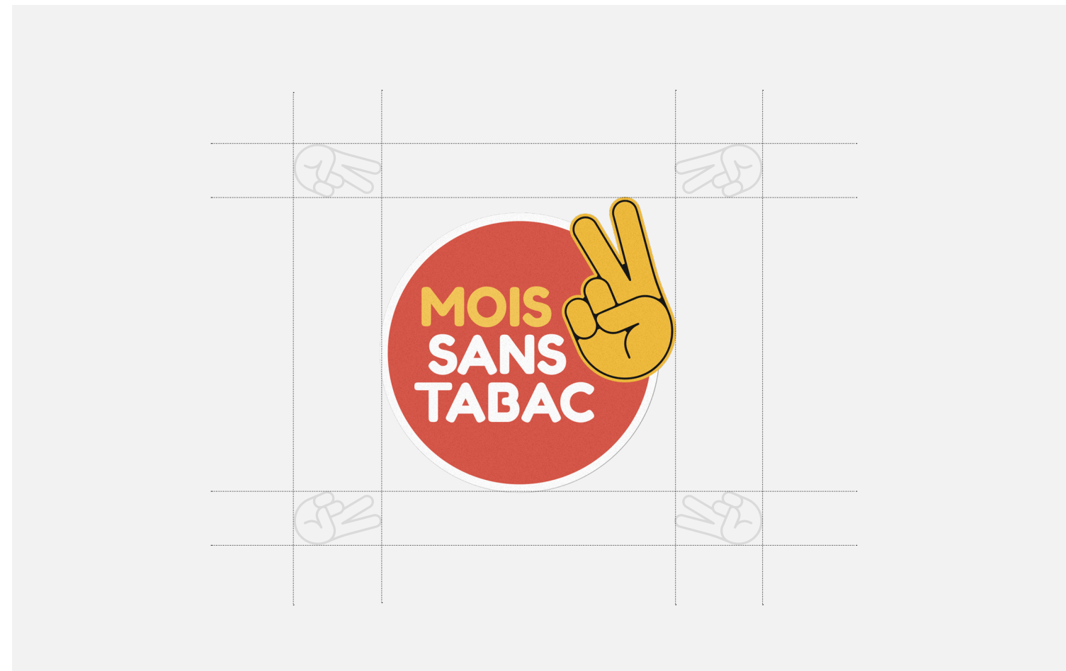
Zone de sécurité / Prints

Pour respecter l'intégrité du logotype, il est impératif d'installer une zone de sécurité inviolable. Elle est applicable sur tous les supports et types de communication. Cette zone de respiration correspond à la grille ci-dessus.