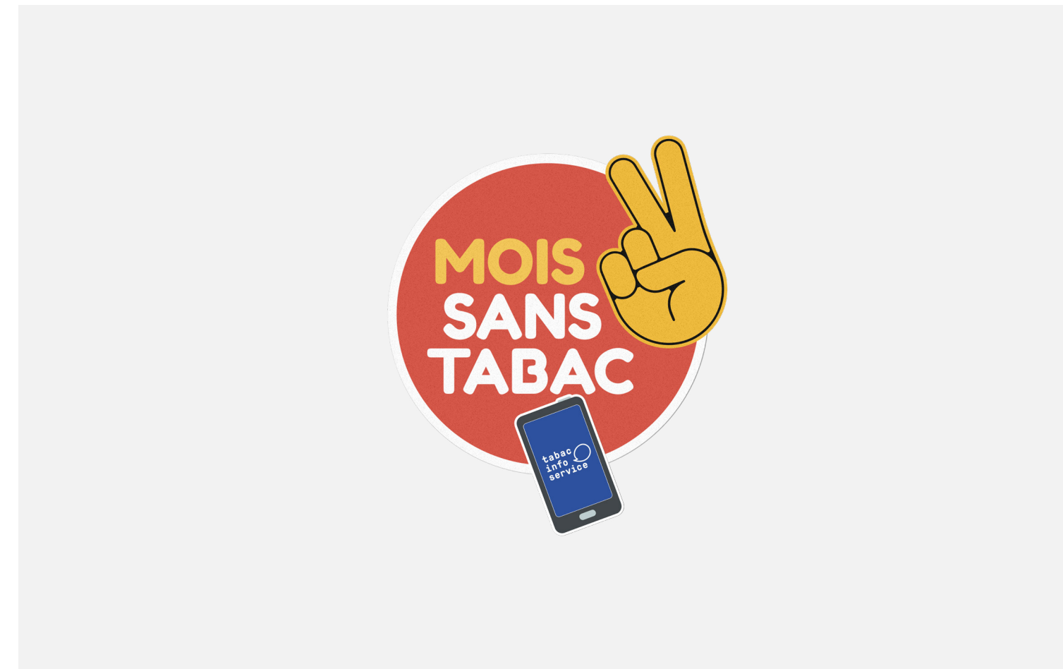
Zone de sécurité / Films

Suite au principe d'accumulation de plusieurs stickers sur les vidéos, la règle des zones de sécurité ne s'applique pas sur ces formats.